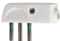
00206.B - Spina 2P+T 10A SPA11 90° bianco