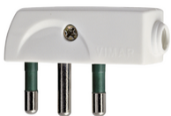
00207.B - Spina 2P+T 16A SPA17 90° bianco