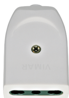
00223.B - Preso 2P+T 16A P17/11 assiale bianco