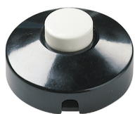
00680N - Interruttore a pedale 1P nero