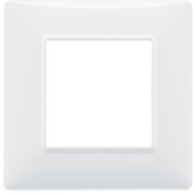
14642.01 - Placca 2M bianco