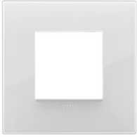
19642.B66 - Placca Classic 2M Reflex ghiaccio t.look