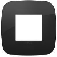
19672.81 - Placca Round 2M nero