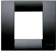
17097.16 - Placca Classica 1-2M nero