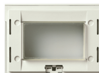
16813.Q.B - Supporto IP55 3M bianco