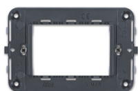
16723 - Supporto 3M Arké Idea + viti grigio