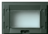
16813.Q - Supporto IP55 3M grigio