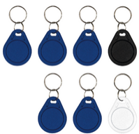
40169 - 7 Chiavette RFID Mifare