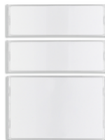
42920.K - Kit 1-2-4 tasti per targa kit Video RFID